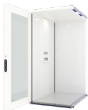
OPALE BLANC en option