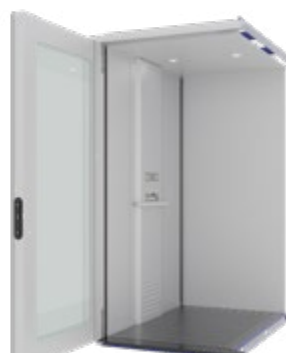
OPALE STEEL en option