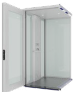
OPALE ALU standard