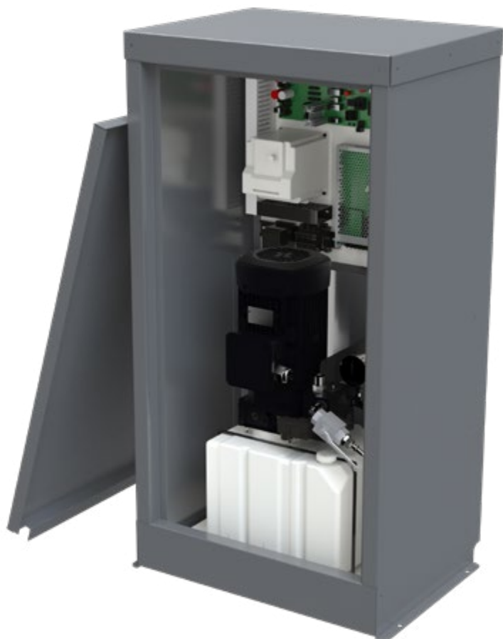
Coffret technique intégrant le groupe hydraulique, l'automate de gestion et le tableau d'alimentation installé (L620mm x P450 x H1100)

OPALE peut être installé dans un pylône tôle ou vitré. En service simple ou opposé (service équerre sur étude). Non pare-flamme.