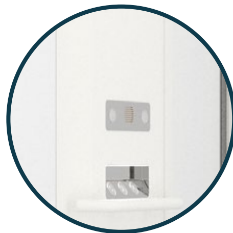
Boutons de commande à pression maintenue (le déplacement de l'appareil est conditionné à l'appui continu sur le bouton de commande)