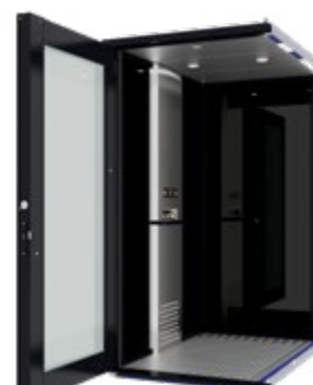
OPALE NOIR en option